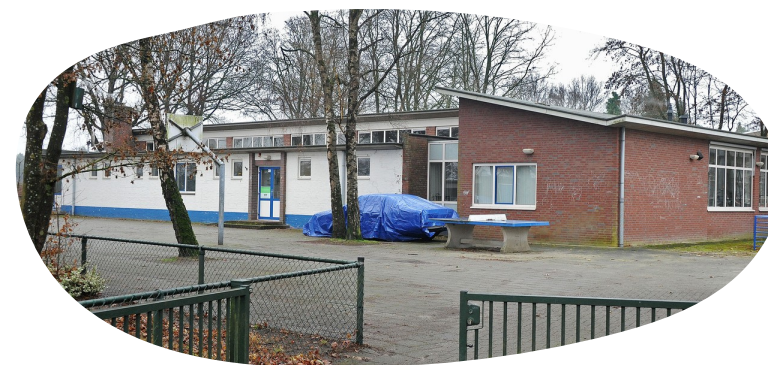
Regina Pacis, Vredepeel