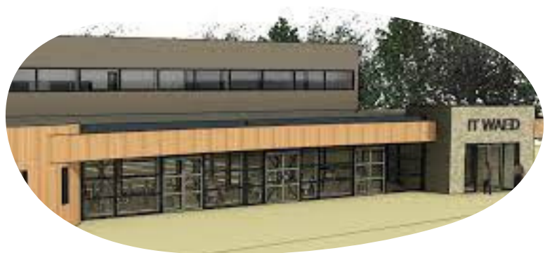
MFA it Waed, Sexbierum-Pietersbierum