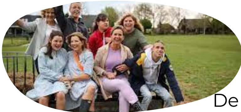
De Droom van Schalkwijk