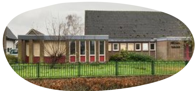
Sint Antonis, Veulen