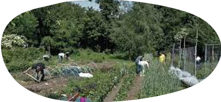
Graafse Akker, Den Bosch